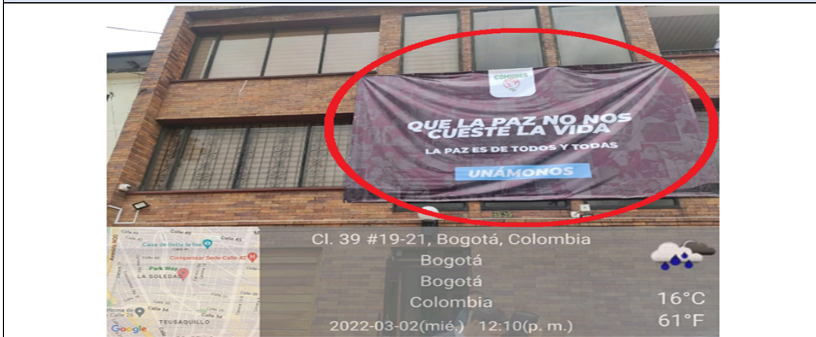
Foto No. 2 elemento publicitario ubicado sobre la calle 39 con texto publicitario "COMUNES + LOGO + QUE LA PAZ NO NOS CUESTE LA VIDA+ LA PAZ DE TODOS Y TODAS + UNÁMONOS", el cual se encuentra superando el antepecho del segundo piso, así mismo supera el 30% de la fachada.